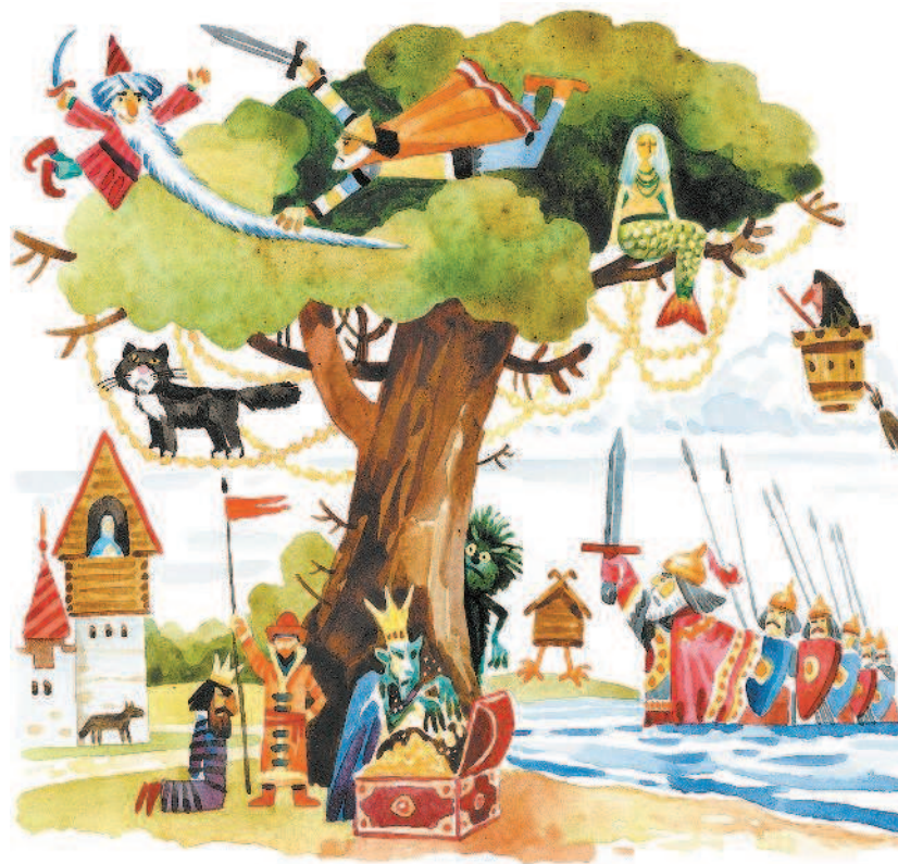
А.И. Крысов. Лукоморье

Создайте свой образ могучего растения, в котором отразились бы ваши собственные представления о мироздании. Работу выполните тушью, пером с использованием цветных карандашей или фломастеров. Используйте в работе знания о стилизации, равновесии, выразительности силуэта, ритме линий и пятен.