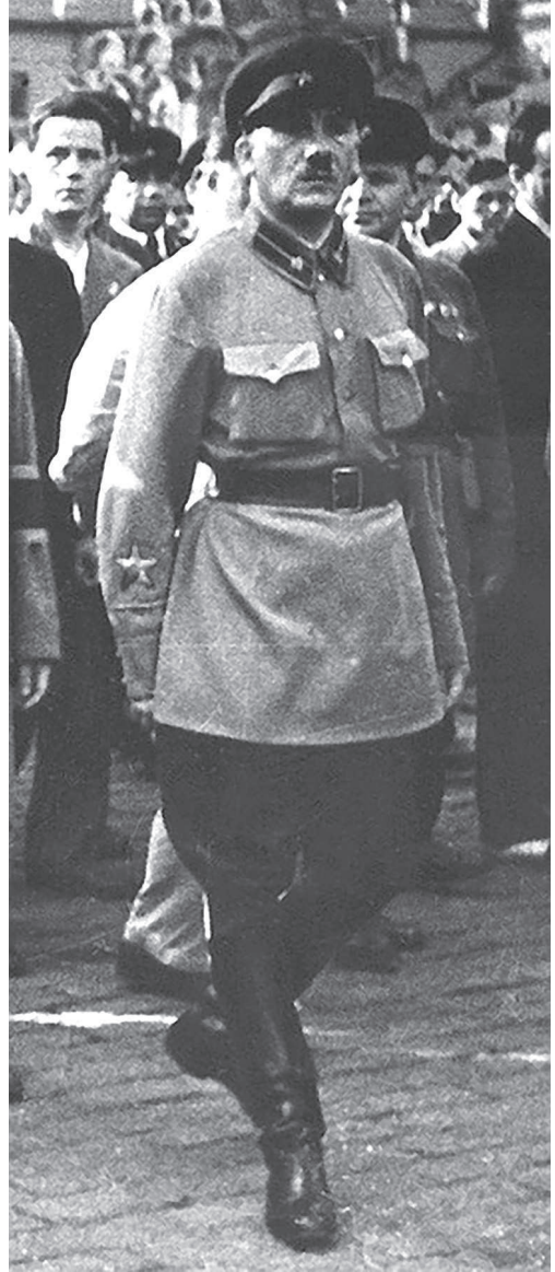
Г.Г.Ягода – нарком внутренних дел СССР (1934 –1936)

30 января 1930 года Политбюро ЦК ВКП(б) принимает решение о реорганизации внешней разведки. Перед ней ставится задача активизировать разведывательную работу по Англии, Франции, Германии, Польше, Румынии, Японии, странам Прибалтики и Финляндии.