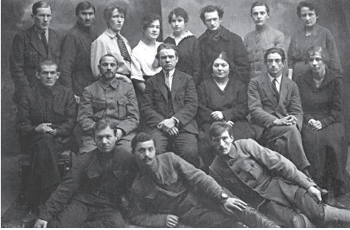
Сотрудники Восточного отдела

стол въездов; стол въездов и выездов эшелонами; стол приема заявлений; общая канцелярия.