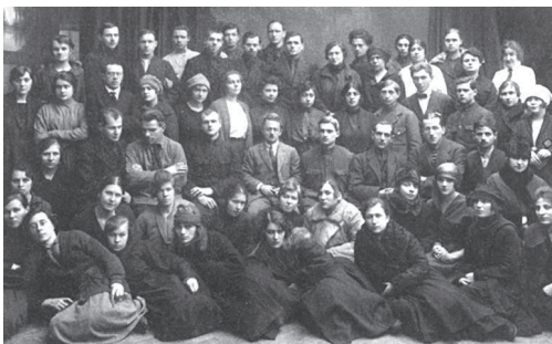
Сотрудники ИНО ОГПУ

При Трилиссере Иностранный отдел был значительно расширен и укреплен кадрами. Центральный аппарат в период его руководства отделом достигал 70 человек. А к моменту ухода Трилиссера из ИНО (1929 год) общий