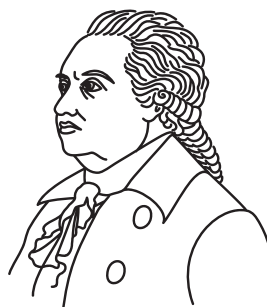
Д. И. Фонвизин