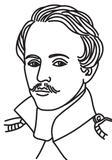
М. Ю. Лермонтов