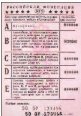
Водительские удостоверения действующие (выдача прекращена 1 марта 2011 г.)

водительское удостоверение или временное разрешение на право управления транспортным средством соответствующей категории или подкатегории;