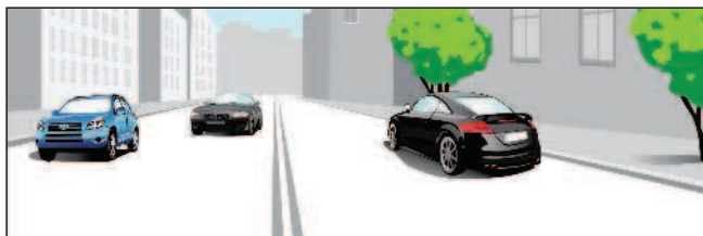
Данная дорога имеет четыре полосы движения

«Пешеход» — лицо, находящееся вне транспортного средства на дороге либо на пешеходной или велопешеходной дорожке и не производящее на них работу. К пешеходам приравниваются лица, передвигающиеся в инвалидных колясках, ведущие велосипед, мопед, мотоцикл, везущие санки, тележку, детскую или инвалидную коляску, а также использующие для передвижения роликовые коньки, самокаты и иные аналогичные средства.