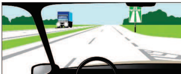
Автомагистраль обозначена знаком 5.1

«Велосипед» — транспортное средство, кроме инвалидных колясок, которое имеет по крайней мере два колеса и приводится