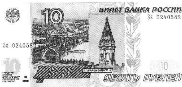
Увеличенное изображение моста с червонца.