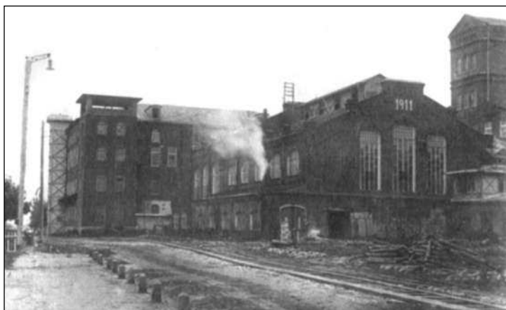
Фабрика имени Вагжанова. Довоенное фото.

полковника В. Краузе. Изначально предназначенная для подготовки личного состава моторизованных частей, на Восточном фронте бригада использовалась как полноценная боевая единица. В ее состав входил 900-й моторизованный пехотный полк из двух батальонов, каждый из которых состоял из трех рот мотопехоты и одной роты тяжелого оружия (2 75-мм легких пехотных орудия, 3 37-мм противотанковые пушки, 6 8-см минометов и взвод саперов). При этом первый батальон передвигался на полугусеничных транспортерах и мотоциклах, второй — на грузовиках. В структуру полка входили также рота пехотных орудий, имевшая на вооружении 4 легких 75-мм и 2 тяжелых 150-мм пехотных орудия, и противотанковая рота (6 37-мм и 2 50-мм противотанковых пушек). Артиллерия бригады была представлена 900-м моторизованным артиллерийским ди-