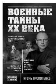
ВОЕННЫЕ ТАЙНЫ XX ВЕКА