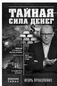
ТАЙНАЯ СИЛА ДЕНЕГ