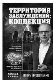
ТЕРРИТОРИЯ ЗАБЛУЖДЕНИЙ: КОЛЛЕКЦИЯ