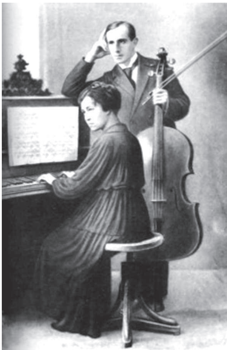
Леопольд Ростропович с супругой Софьей