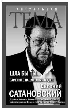
ШЛА БЫ ТЫ...