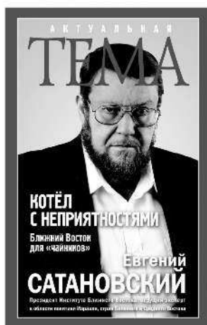
КОТЁЛ С НЕПРИЯТНОСТЯМИ