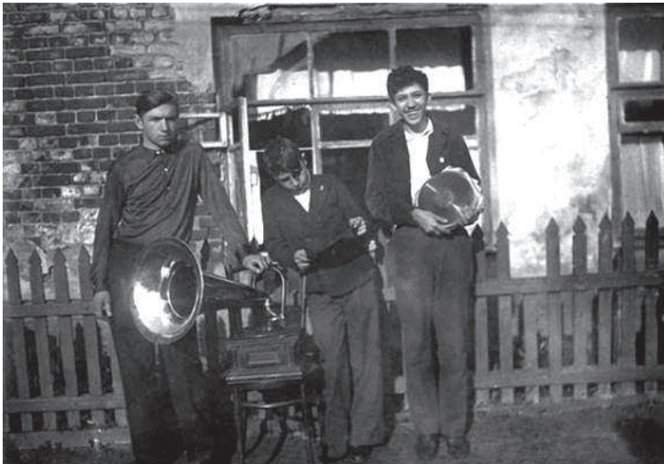
С друзьями и граммофоном. 1930-е годы