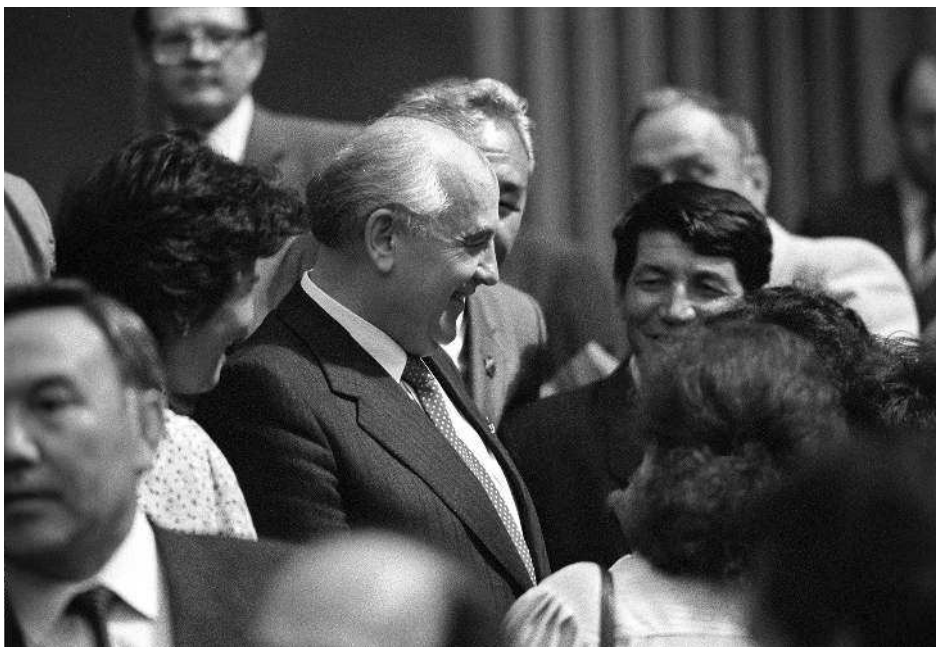
XXVIII съезд Коммунистической партии Советского Союза. Кремлевский дворец съездов. 2–13 июля 1990 года. Генеральный секретарь ЦК КПСС, президент СССР М. С. Горбачев беседует с депутатами съезда