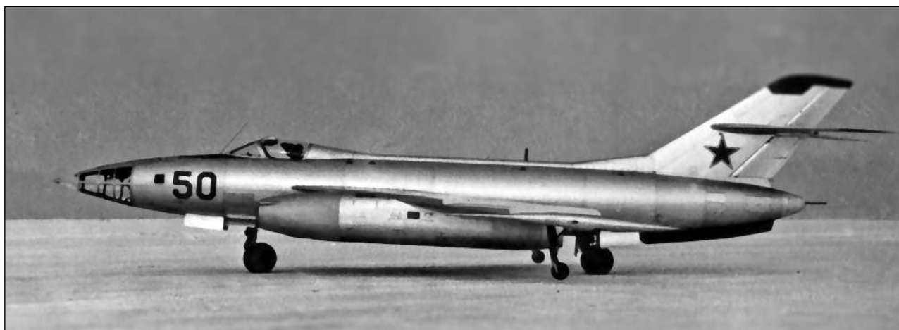
Фронтальной бомбардировщик Як-26

случае крыльевые стойки в предотвращении тяжелых последствий удерживали самолет от опрокидывания на хвост.