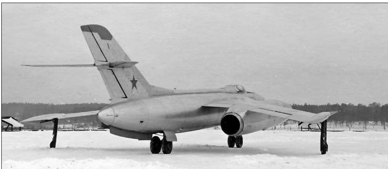
Первый опытный экземпляр фронтового бомбардировщика Як-28