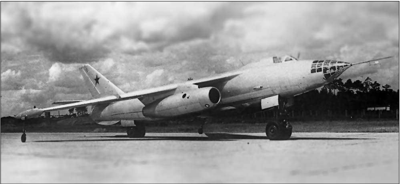
Фронтальной бомбардировщик Ил-54

Установка форсированных двигателей АЛ-7Ф потребует проведения на самолете сравнительно небольших изменений, связанных с креплением двигателей и подводкой к ним коммуникаций...»