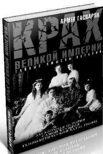
КРАХ ВЕЛИКОЙ ИМПЕРИИ