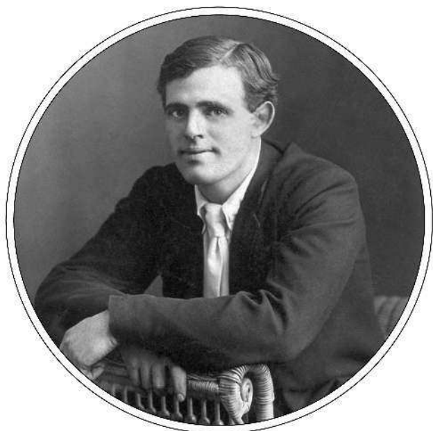
Джон ЛОНДОН (1876 - 1916)