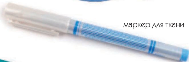
маркер для ткани