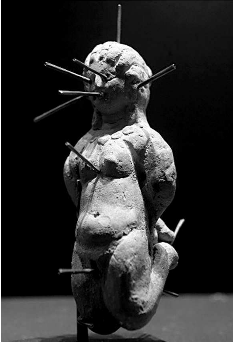
Кукла-проклятие, пронзенная 13 спицами (вуду-кукла). Найдено в Египте. II век н.э.