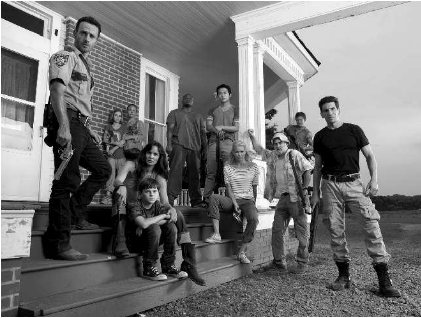
Актеры телесериала «Ходячие мертвецы»