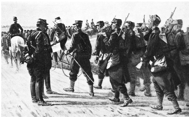
Французская пехота в походе