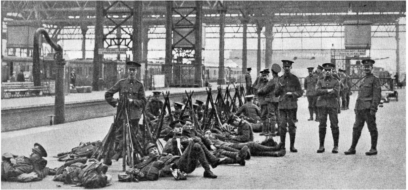
Англия. Вестминстерские стрелки в ожидании отправки

упрощало задачи англичан. Поэтому Франция обязалась сосредоточить все свои морские силы в Средиземном море, а Англия гарантировала Франции защиту ее берегов и морской торговли в Атлантическом океане. В ноябре 1912 г. между сэром Эдуардом Греем и французским послом Полем Камбоном состоялся обмен писем, имевший характер морального обязательства Англии поддержать Францию в случае войны с Германией. В апреле 1914 г. во время посещения Парижа английским королем в сопровождении Эдуарда Грея вопрос о формальном присоединении Англии к франко-русскому союзу, поднятый по почину Извольского, вылился в решение начать непосредственные переговоры между английским адмиралтейством и русским морским агентом в Англии о заключении между Англией и Россией также морской конвенции. Вопрос о формальном присоединении Англии к союзу, о переходе от «согласия» (Антанта) к союзу отклонялся английскими государственными людьми; ввиду популярности в Англии политики свободных рук заключение союза усилило бы в Англии позицию сторонников мира и германофилов.