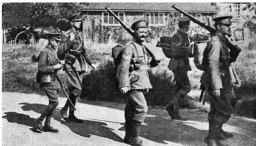
Англия. Принц Уэльский с солдатами своего полка

русский батальон был обеспечен огнем 3 настильных и 0,25 навесного орудия, а германский — 4,5 настильного и 2,17 навесного орудия. Полуторное превосходство в настильном огне и почти девятикратное в навесном не только позволяло германской пехоте гораздо легче разрешать боевые, особенно наступательные, задачи, но могущественно влияло на несравненно более экономное расходование кадров пехоты; русская пехота, оплачивая лишними жертвами боевую работу против превосходной артиллерии, должна была несравненно скорее раствориться в массе пополнений, приобрести милиционный характер, чем германская, и превосходство последней, заметное и в начале войны, должно было вскоре приобрести подчеркнутый характер. Отношения русской пехоты к австрийской вследствие значительного превосходства русской артиллерии складывались в обратном отношении, и австрийская пехота, не уступавшая русской в первых боях, вскоре вследствие громадных потерь австрийцев значительно разложилась и потеряла боеспособность. Французы не уступали германцам в количестве легкой артиллерии, но имели в 5 раз слабейшую тяжелую артиллерию, и потому в начале войны могли успешно разрешать только оборонительные задачи.