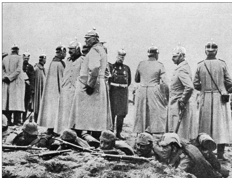
Германская армия. Император Вильгельм и начальник штаба фон Мольтке на позиции у окопов

чительно расширены — в отношении снарядов в три раза. Выполнение спешных заказов по военному снабжению значительно развило русскую военную промышленность. В мобилизационном отношении были также сделаны большие успехи — кадры усилены, производство учебных и поверочных сборов позволило проконтролировать технику мобилизационного аппарата, железные дороги были вполне подготовлены к предстоявшей им ответственной задаче. Можно утверждать, что благодаря всестороннему испытанию русской военной системы в Русско-японскую войну в отношении снабжения и организации русская армия к моменту мировой войны повысила свою боеспособность за последние 10 лет, по крайней мере на 300%. Неменьший прогресс надо отметить и в отношении тактической подготовки войск и в повышении квалификации среднего и низшего командного состава. Наша артиллерия сохранила свою неудовлетворительную организацию в 8 орудийных батареях, тяжелая артиллерия находилась еще в процессе создания; однако в техническом отношении наши батареи ушли далеко вперед от того жалкого уровня, на котором находились в Русско-японскую войну,