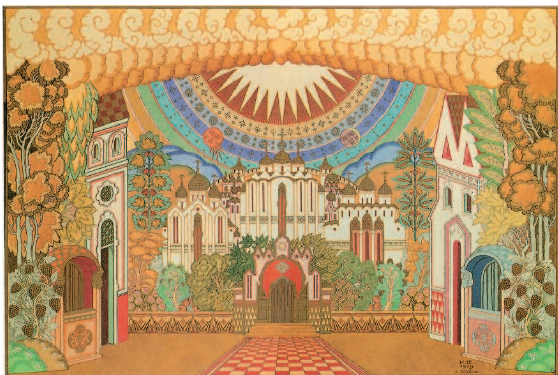
И. Билибин. Преображённый Китеж

Многие русские композиторы воспроизводили звучание колоколов в музыкальных произведениях. Одно из таких произведений — опера Н. Римского-Корсакова «Сказание о невидимом граде Китеже и девице Февронии».