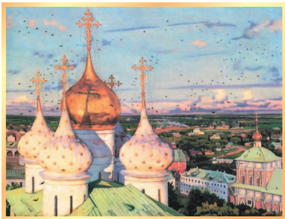
К. Юон. Купола и ласточки

С давних времён на Руси с большим почитанием относились к колоколам и колокольным звонам. В звучании колоколов отражена душа русского народа, вся его жизнь.