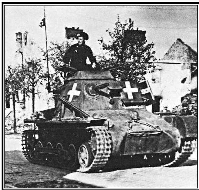
Командирский танк Panzer I, Радзимин, 27 сентября. Молодой командир немецкого танка ведет колонну немецких танков по дороге на Варшаву. Во время Польской кампании в качестве опознавательного знака немецких машин использовался белый крест.

В результате германский генеральный штаб не был до конца уверен, что основные силы польской армии попали в окружение, — и танки 10-й армии развернули на север, формируя вдоль реки Бзуры, западнее Варшавы, еще один заслон. Здесь прошла самая жестокая битва кампании, но поражение поляков было уже предreshено. При всем своем отчаянном мужестве, они сражались перевернутым фронтом против сильного, хорошо окопавшегося противника, которому для победы нужно было лишь держаться, а после первого дня польский тыл беспокоили части 8-й армии