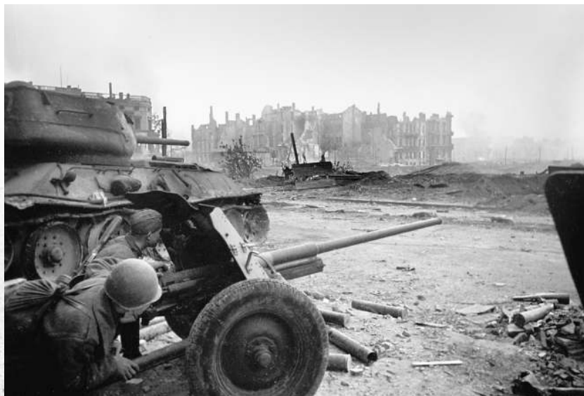
Бой на подступах к Рейхстагу. Берлин

В этот день на всех фронтах подбито и уничтожено 50 немецких танков и самоходных орудий. В воздушных боях и огнем зенитной артиллерии сбито 40 самолетов противника.