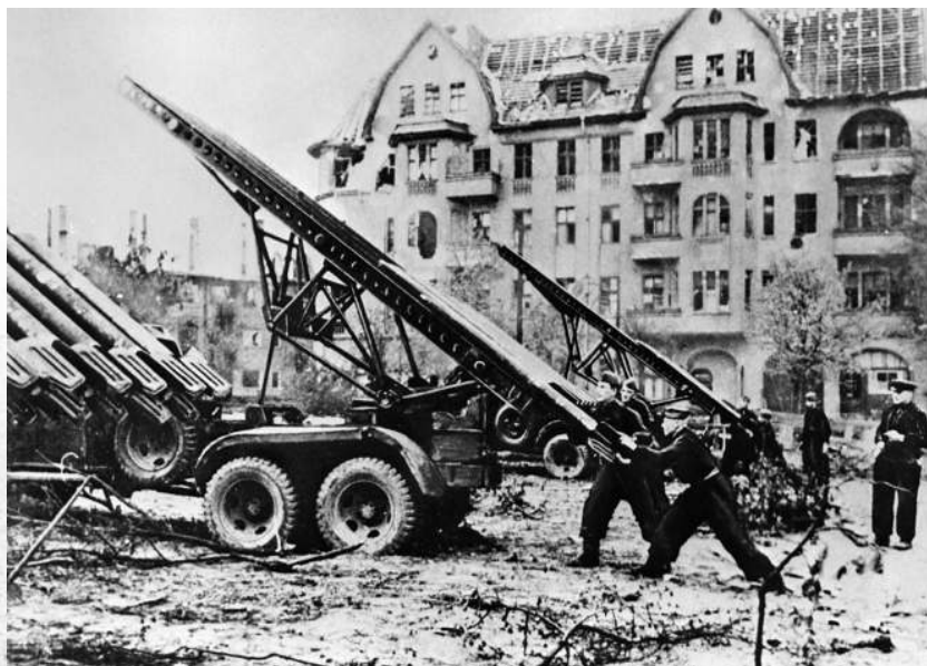
Советские артиллеристы во время боев на улицах Берлина

Наша авиация наносила бомбардировочно-штурмовые удары по скоплениям войск и техники противника.