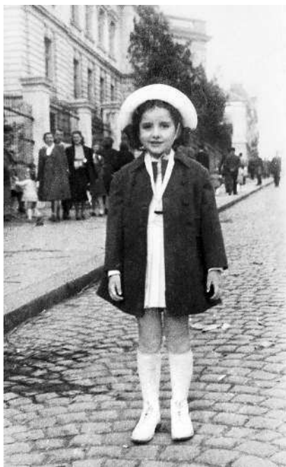
Я в Белграде. 1951

Невероятно, как твои родители и окружение встраивают в тебя страх. А ты столь невинен вначале, что даже не подозреваешь об этом.