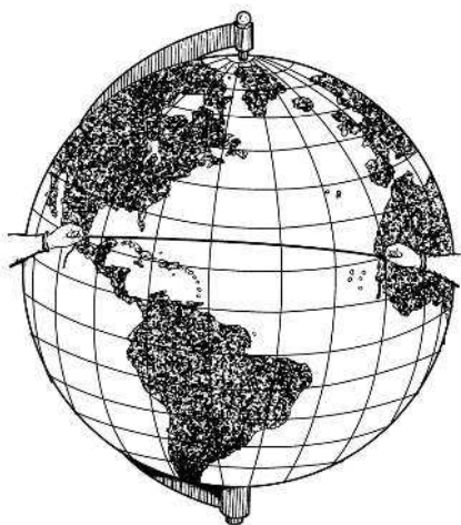
Рис. 3. Простой способ отыскания действительно кратчайшего пути между двумя пунктами: надо на глобусе натянуть нитку между этими пунктами

После сказанного становится понятным, почему кратчайший путь на морской карте изображается не прямой, а кривой линией.