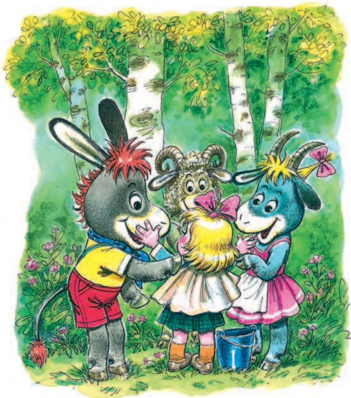
Рисунки А. Савченко