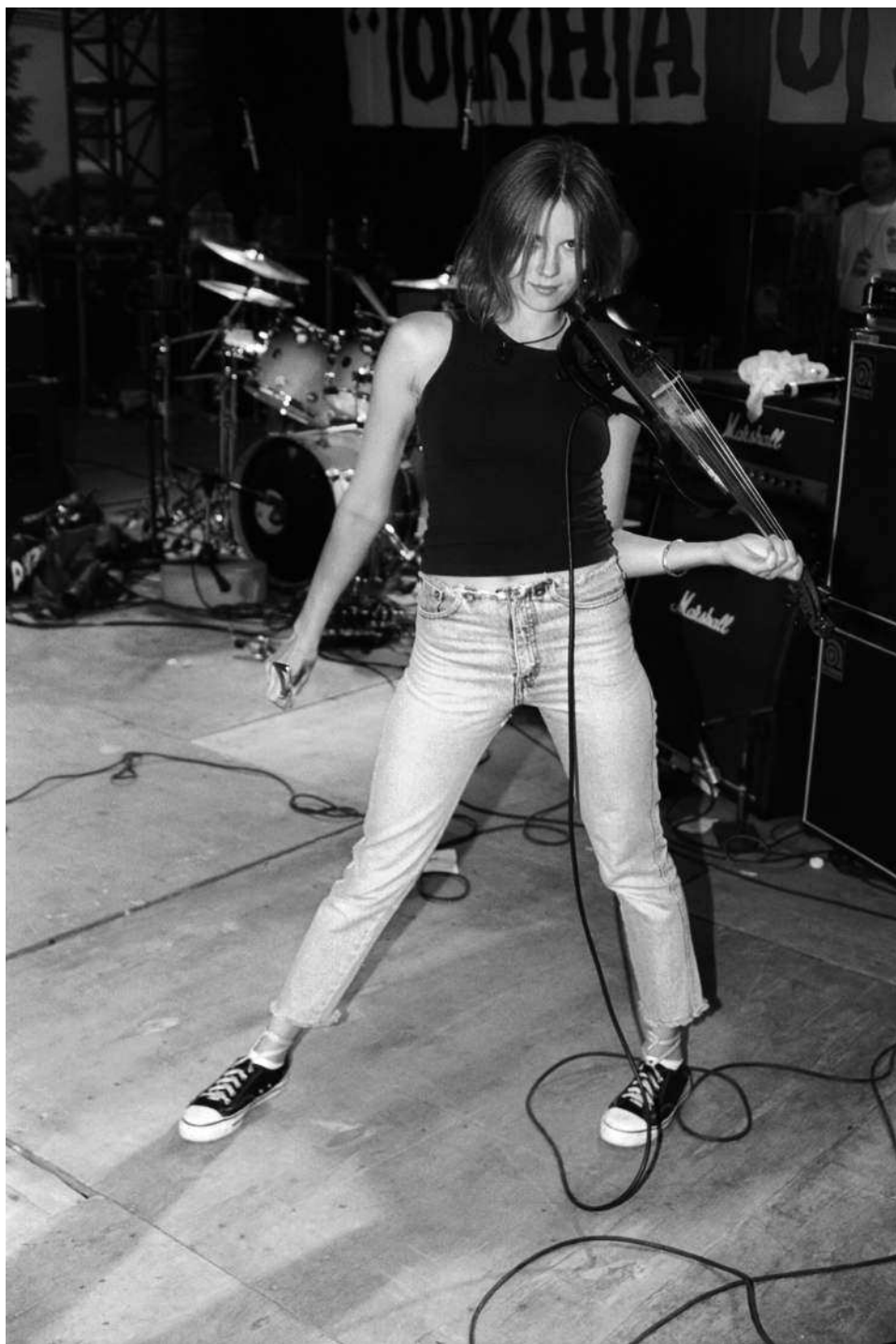
Маша на фестивале «Окна Открой!». Стадион и.и. Кирова, 23 июня 2002 года.