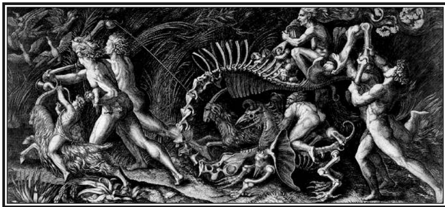
Агостино Венециано. ШАБАШ. 1515—1525 гг.

Два других лжеучения не отрицают бесов и их природной силы, но они несогласны между собою относительно чародейства и сущности ведьм. Одно из них признаёт необходимость участия ведьмы для колдовства, но отрицает реальность результатов этого последнего. Дру-