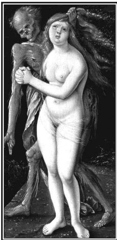
Ханс Бальдунг Грин. СМЕРТЬ И СЛАДОСТРАСТИЕ. 1517 г.

ство: «если бы таковые существовали, то это было бы делом рук дьявола. Утверждать же, что бесы могут производить телесные превращения или им препятствовать, не является правоверным, так как в таком случае они могли бы разрушить весь мир».