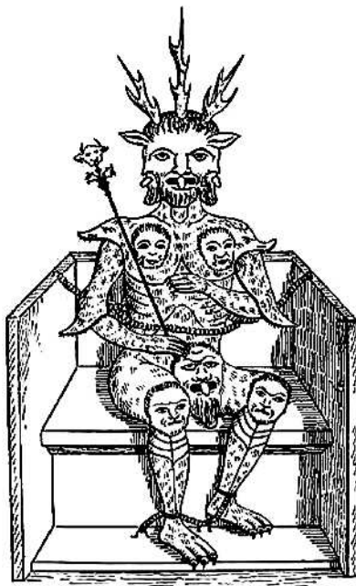
САТАНА. Миниатюра из «Истории Святого Грааля». XV в.

Что эти лжеучения еретичны и противоречат здравому смыслу канона, будет доказано на основании Божественного церковного и гражданского прав, это вообще, а в частности — из толкования слов канона. Божественное право предписывает во многих местах не только избегать ведьм, но и умерщвлять их. Оно не